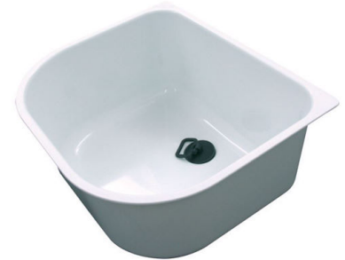
Cubeta blanca 8152 100

* sólo en combinación con el accesorio 8100 112