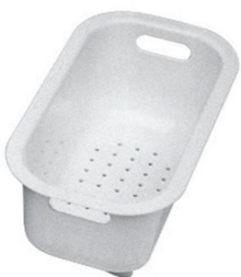
escurre pasta blanco 8151 100

* sólo en combinación con el accesorio 8100 112