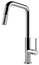
Monomando KS Plus 8522 000