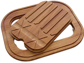
Tabla de corte Twin de madera Iroko 8644 003