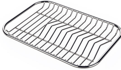
Rejilla portaplatos inox 8100 154