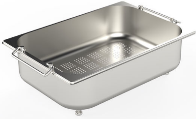
escurre pasta en acero inoxidable 8154 000