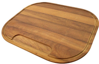
Tabla de corte de madera Iroko 8659 112